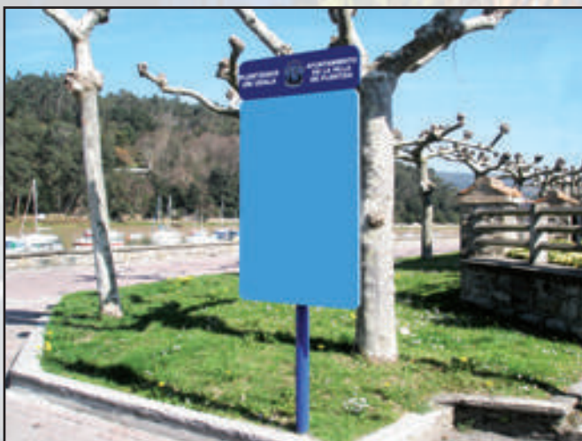
Ayuntamiento de Plentzia