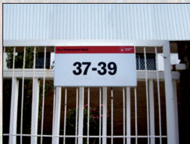
Ayuntamiento de Gavà Gama Tradicional 400 x 200 mm Serigrafía + esmaltado Dorso Blanco