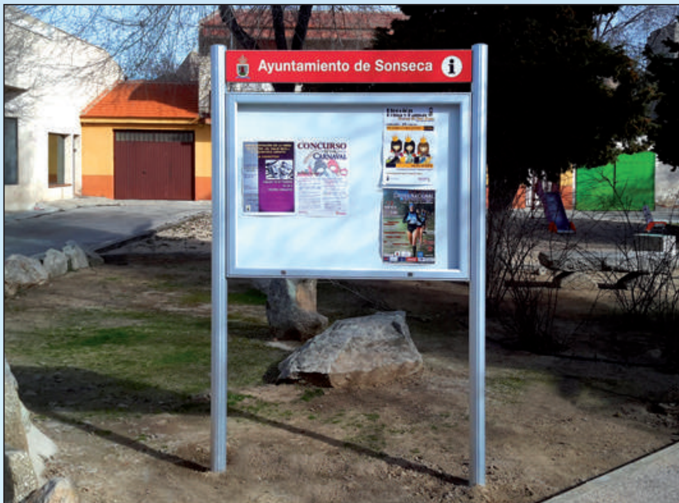
Ayuntamiento de Sonseca Gama Tradicional 1350 x 1000 mm Sistema de llave e imanes Dorso Plata