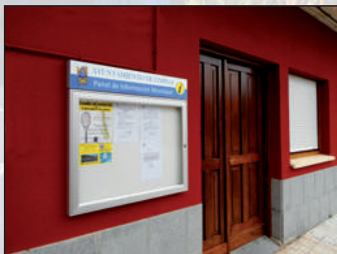
Ayuntamiento de Limpías Gama Tradicional 1000 x 170 + 1000 x 750 mm Sistema de llave e imanes Dorso Plata