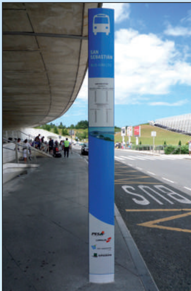
Ayuntamiento de San Sebastián