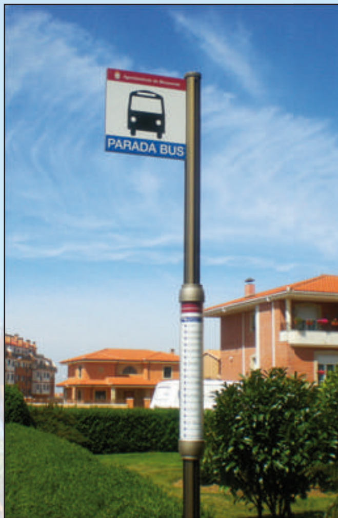
Ayuntamiento de Benavente