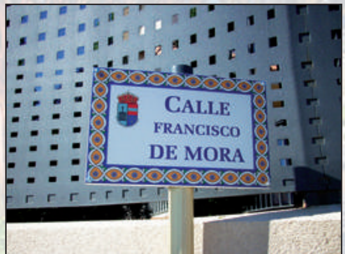
Ayuntamiento de San Lorenzo del Escorial Gama Tradicional 450 x 300 mm Reflectante RA1 (impresión de vinilo) Dorso Oro