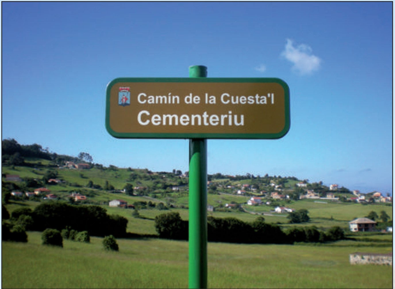
Ayuntamiento de Gijón Gama Tradicional 600 x 200 mm Reflectante RA1 (impresión de vinilo) Dorso Verde