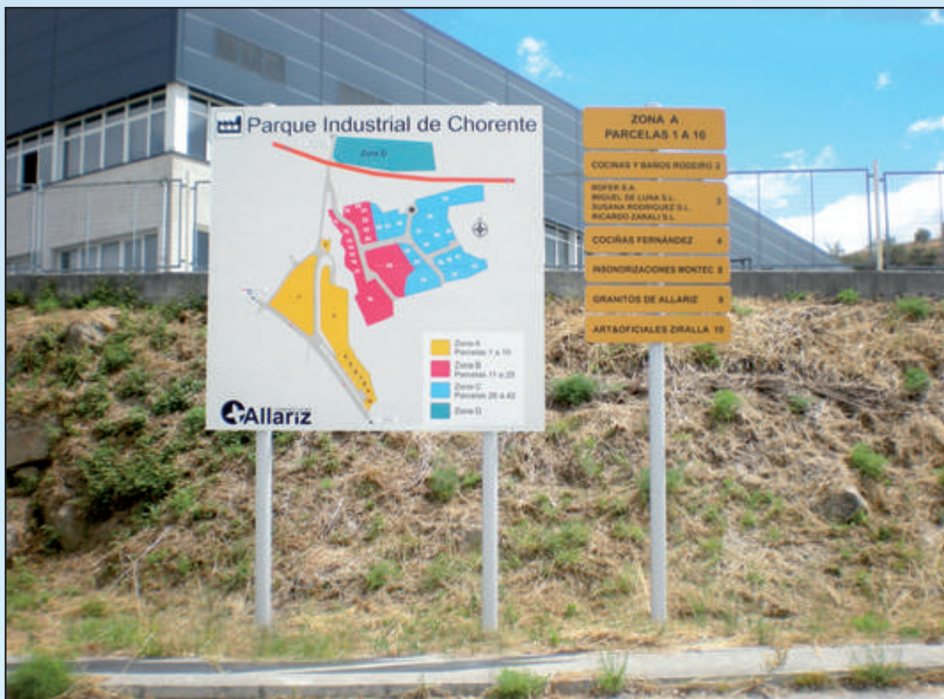
Ayuntamiento de Allariz Gama Monobloc 2000 x 2000 + 900 x 250 mm Reflectante RA1 (impresión de vinilo) Dorso Plata