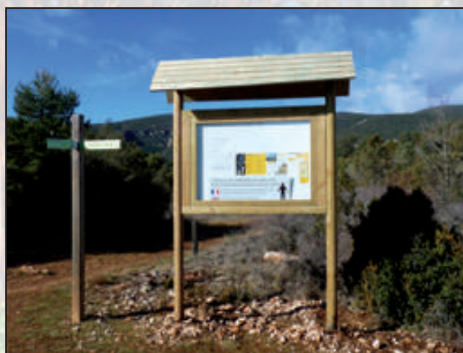
Comarca de Somontano Gama Madera 1350 x 1000 mm Sistema de llave e imanes Dorso Madera