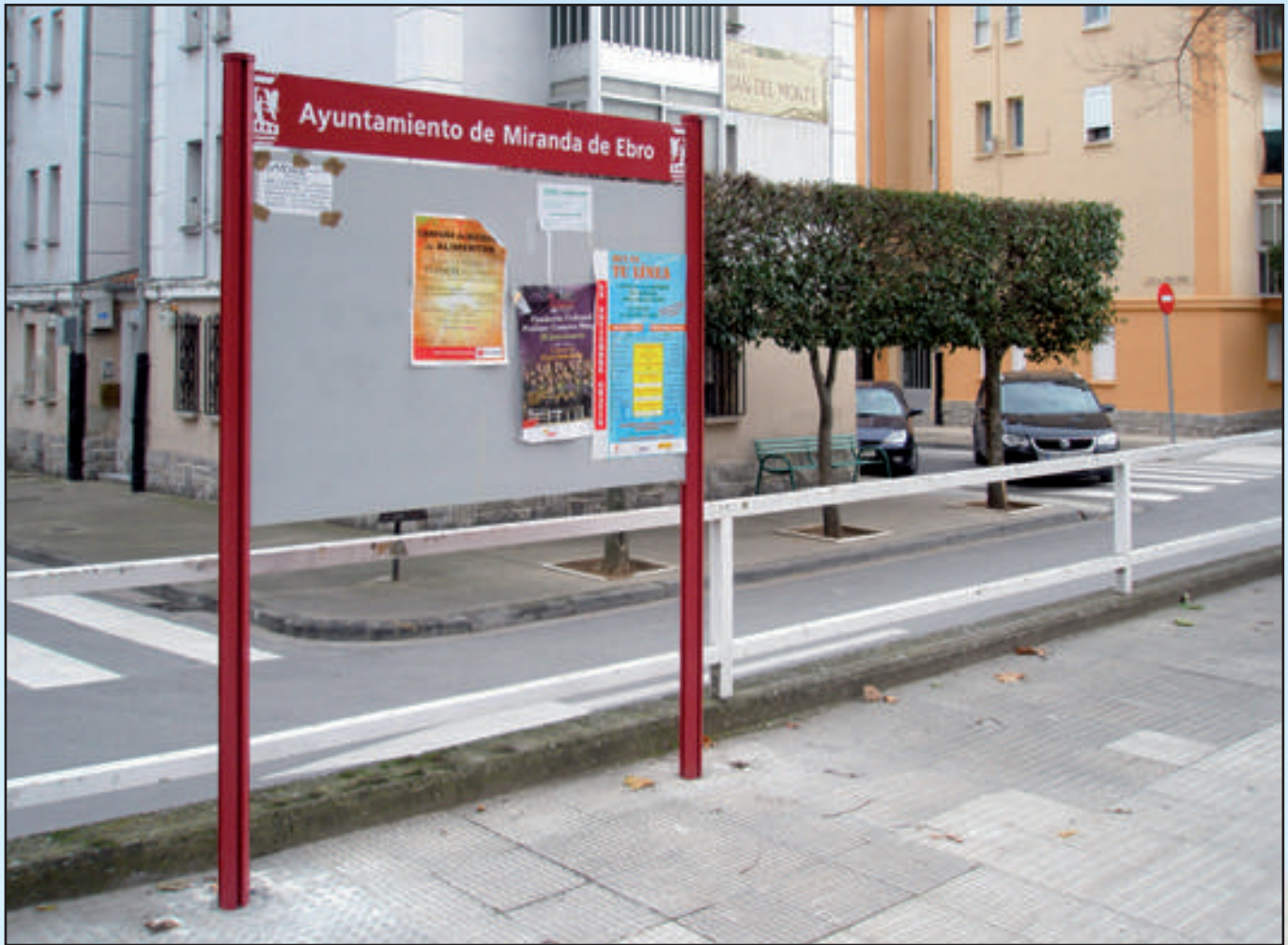
Ayuntamiento de Miranda de Ebro