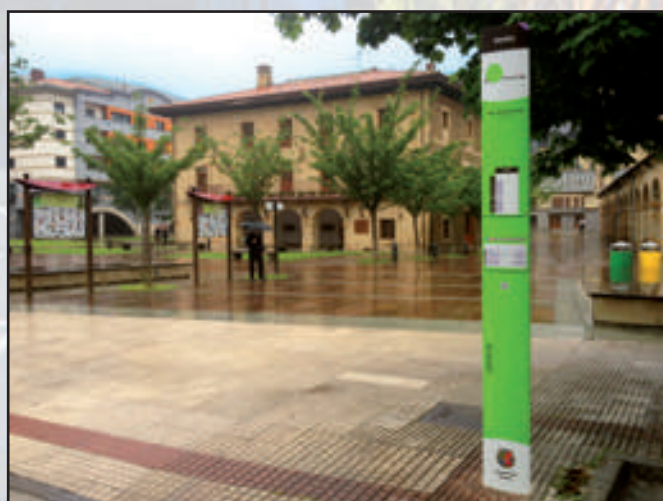
Ayuntamiento de Legazpi