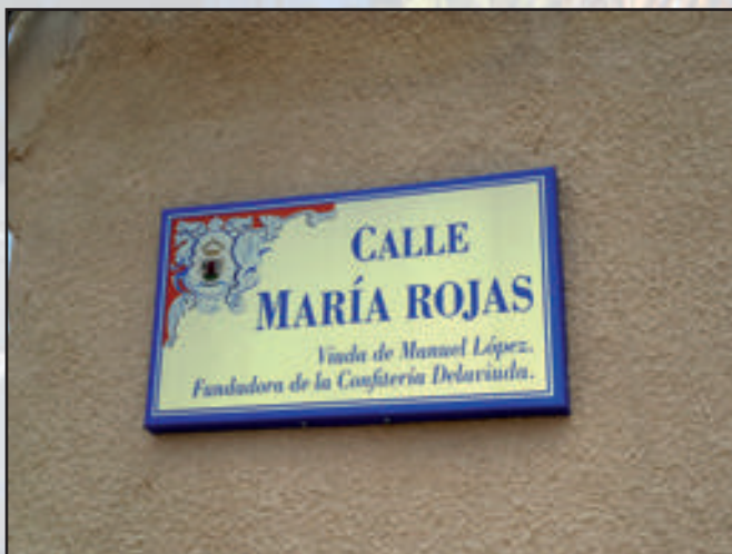
Ayuntamiento de Sonseca Gama Tradicional 500 x 300 mm Reflectante RA1 (impresión de vinilo) Fijación a pared mediante contraplaca