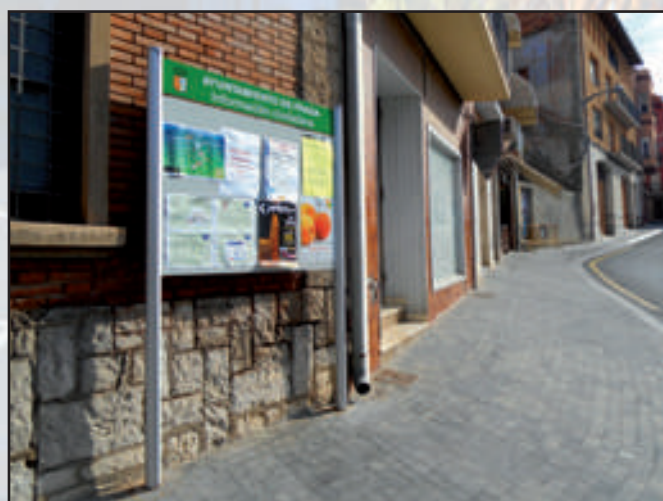
Ayuntamiento de Fraga Gama Estilo 1350 x 200 + 1350 x 1000 mm No Reflectante Dorso Plata