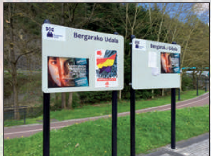
Ayuntamiento de Bergara