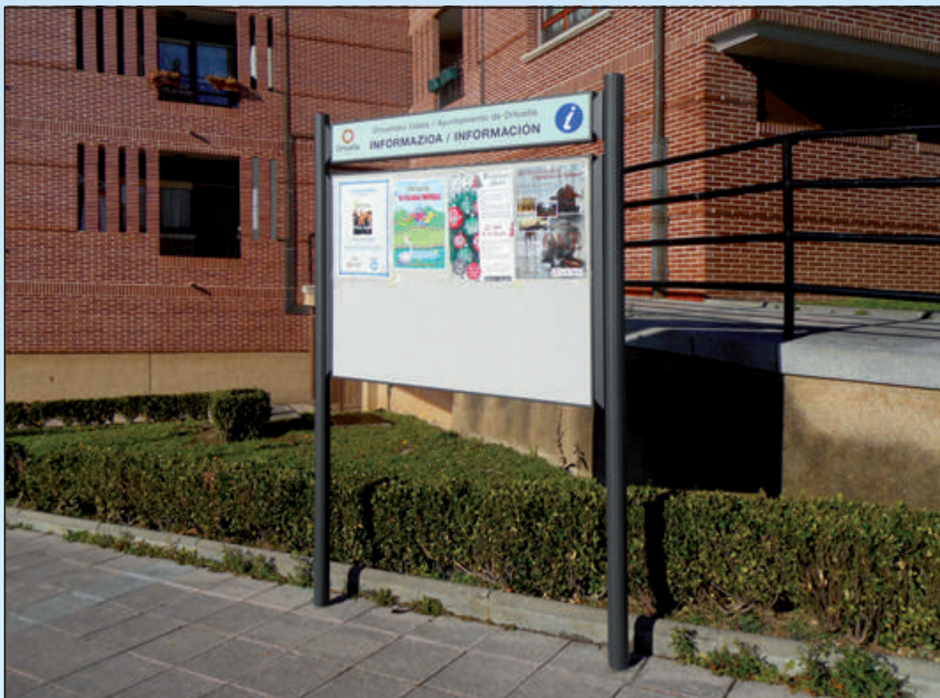
Ayuntamiento de Ortuella Gama City 1350 x 200 + 1350 x 1000 mm No Reflectante Dorso Gris Forja