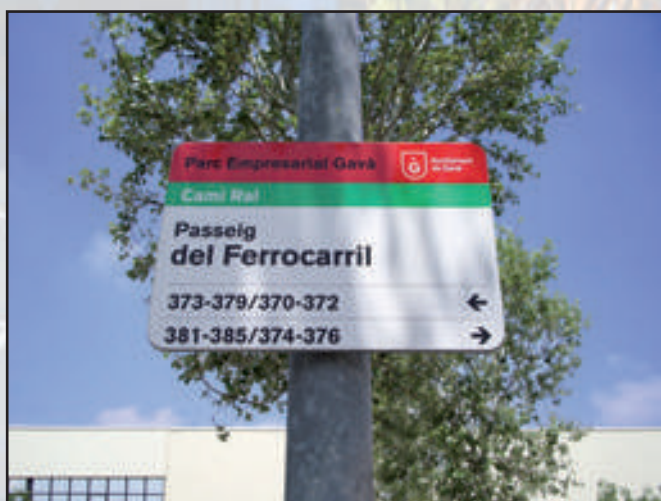
Ayuntamiento de Gavà Gama Tradicional 900 x 600 mm Reflectante RA1 (impresión de vinilo) Dorso Plata