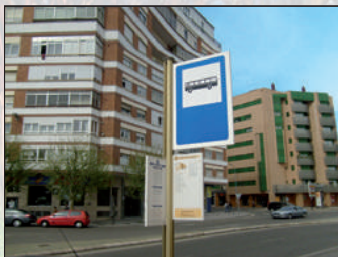
Ayuntamiento de León