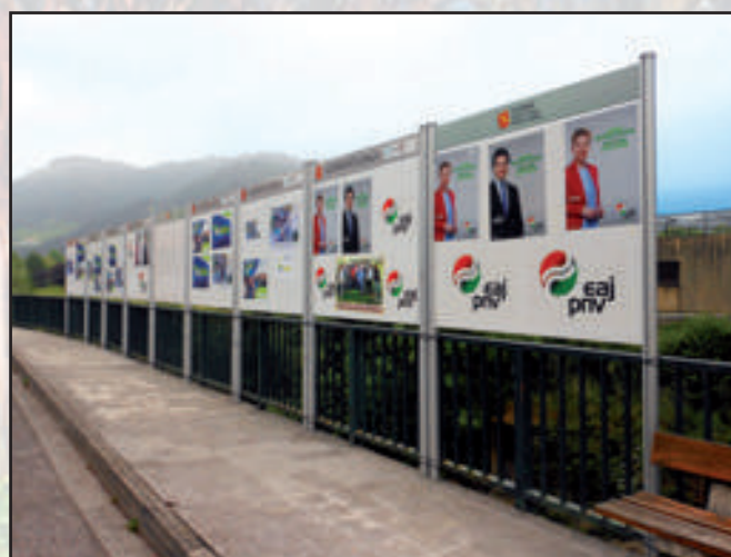
Ayuntamiento de Igorre Gama Estilo 1710 x 200 + 1710 x 1350 mm No Reflectante Dorso Plata